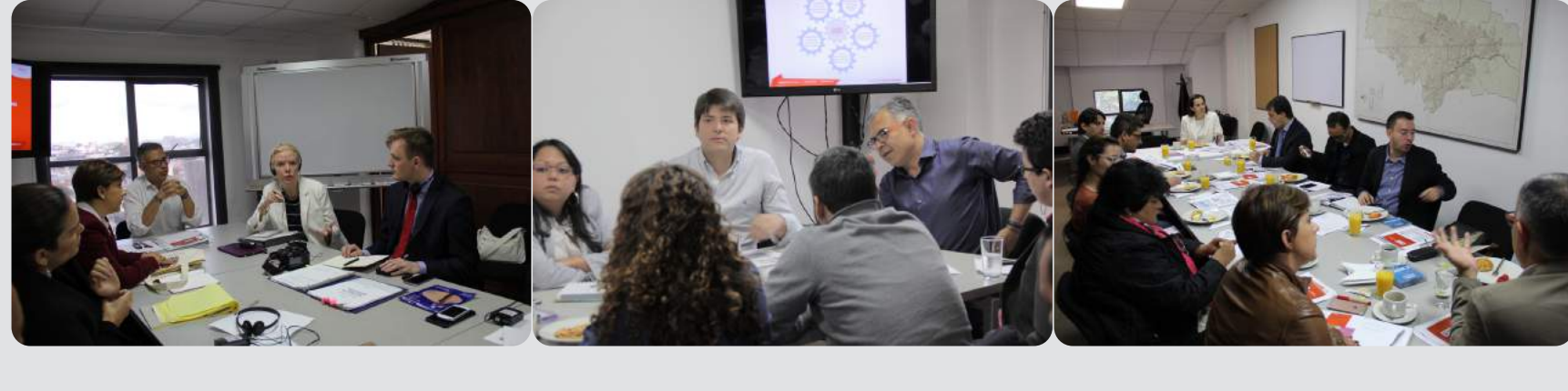
Algunas de las reuniones sostenidas con la Unidad Municipal Integrity de Bloomberg Associates, Secretaría de Gobierno, Representantes a la Cámara por Bogotá, Contralor de Bogotá, Bogotá Cómo Vamos y con la Unidad Administrativa Especial de Servicios Públicos (Uaespp).

Este trabajo demanda un seguimiento permanente a las agendas y a las mesas de trabajo definidas entre las partes para fortalecer técnicamente los proyectos estratégicos, los procesos transversales de seguimiento al Plan Distrital de Desarrollo 2016-2020 y las acciones preventivas en la gestión local.