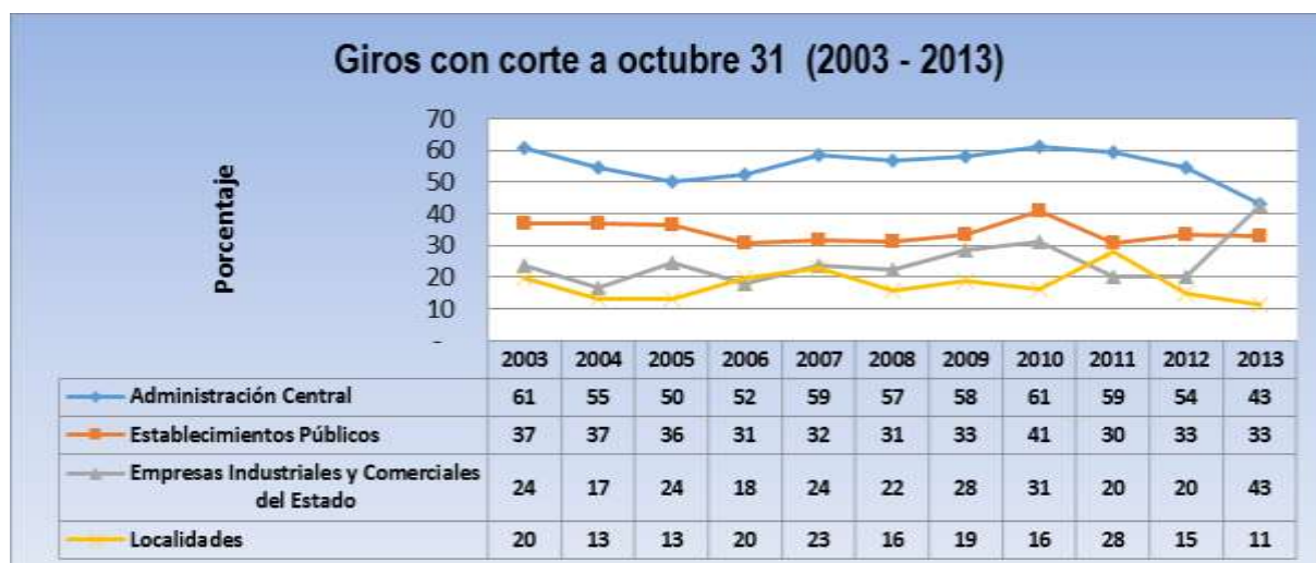
Gráfica No.2 Porcentaje de giros a octubre 31 en el periodo 2003 – 2013