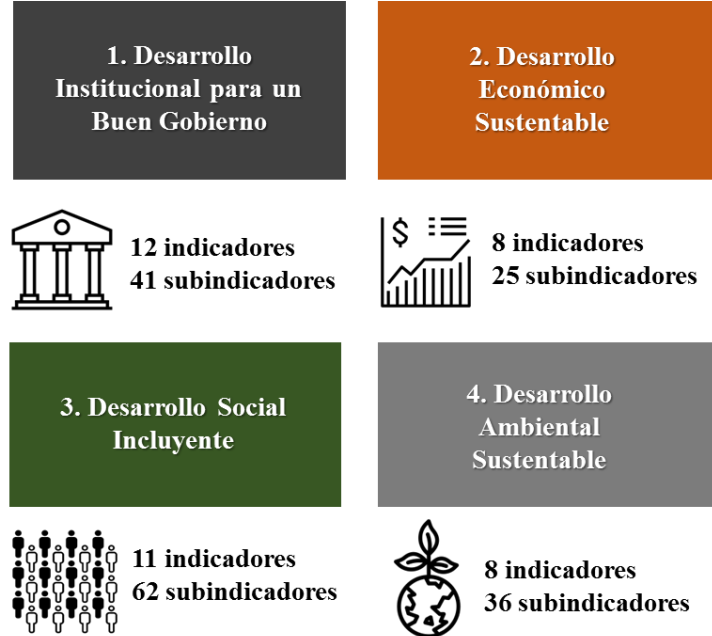
Figura 1. Ejes e indicadores de la Herramienta de Seguimiento Distrital