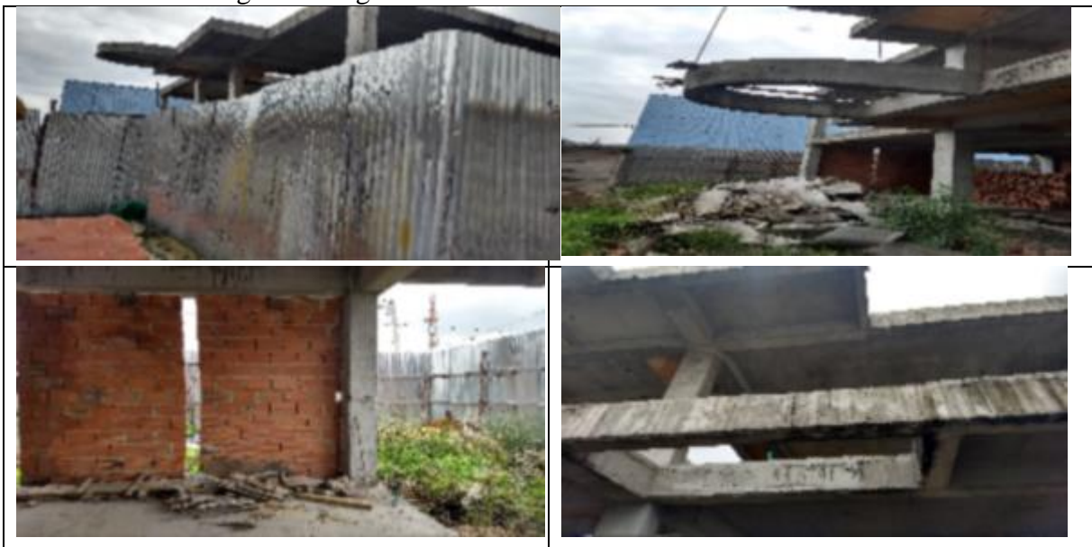
Ilustración 1. Registro fotográfico del Jardín Cementerio de Fontibón de abril 5 de 2018

Con el fin de verificar los hechos denunciados, este Organismo de Control realizó visita el 5 de abril de 2018 al Jardín Cementerio de Fontibón, para revisar la existencia de la construcción de los hornos crematorios, evidenciando que si existe la misma, pese a que no se observó que en la actualidad se estuvieran realizando obras, tal como se puede observar en el siguiente registro fotográfico: