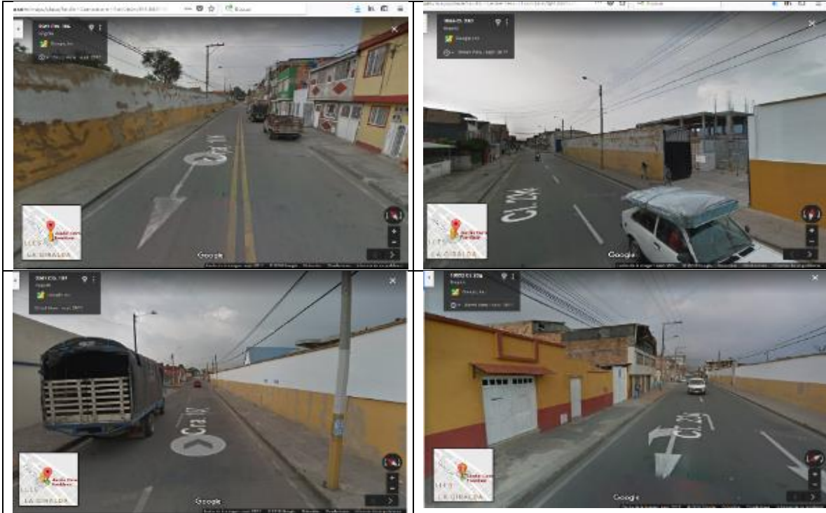
Fuente. Tomado de Google Maps referenciando el Jardín Cementerio de Fontibón y las 4 cuadras aledañas que bordean el Jardín Cementerio de la localidad de Fontibón.

Finalmente, se remitió el 11 de mayo de 2018, alerta preventiva a la Secretaría Distrital de Planeación para que evalúe técnica y jurídicamente, los elementos allí expuestos para el estudio y aprobación del plan de regularización y manejo del Jardín Cementerio de Fontibón, para lo cual se dio un término de 5 días hábiles siguientes al recibo de la misma, solicitud que se encuentra en término para dar respuesta.