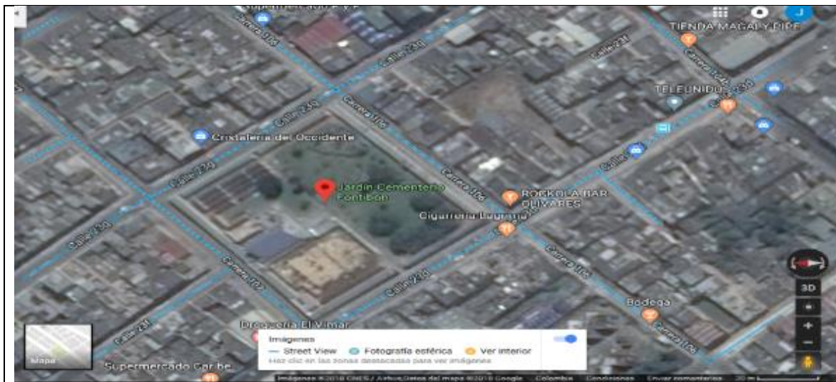
Ilustración 3. Registro en Google Maps de las viviendas aledañas al Jardín Cementerio de Fontibón

Lo anterior, por cuanto en visita administrativa de abril 5 de 2018 realizada por este Organismo de Control al Jardín Cementerio de Fontibón, como se puede observar en el aplicativo Google Maps al tomar pantallazo al cementerio y su entorno, se encuentra en zona residencial.