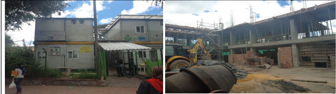
Figura 3. Entrada, aviso de licencia de construcción y vistas internas del Jardín Infantil El Principito en la Localidad de Fontibón.