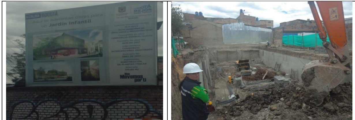
Figura 2. Aviso con información de la obra y vista interior del Jardín Infantil El Nogal en la localidad de Barros Unidos.