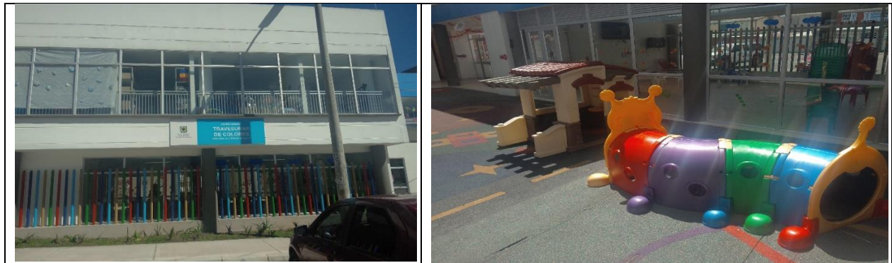
Figura 4. Visa exterior e interior del Jardín Infantil Travesuras de Colores en la Localidad de Rafael Uribe Uribe.